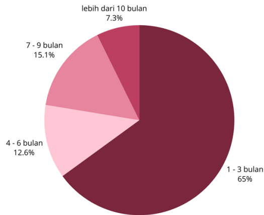
Gambar 3. Diagram persentase

hal itu, waktu yang dibutuhkan lulusan untuk mendapatkan pekerjaan pertama dapat terlihat pada Gambar 3 dengan berbagai rincian dalam bulan.